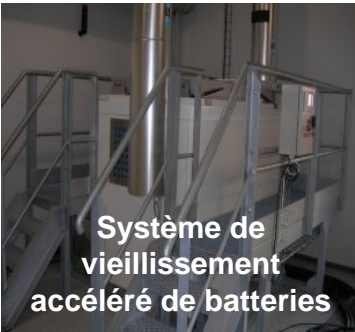
Plate-forme de R&D pour l'optimisation du stockage de l'énergie électrique