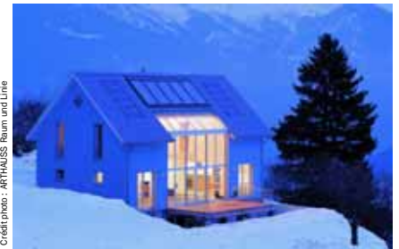
Maison Minergie 185 m 2 , chauffage : 22 kWh/m 2 .an

Le label Minergie s'applique à tous types de construction. Il impose aux constructeurs d'intégrer la notion de coût dans leurs réalisations dont le budget ne doit pas dépasser de plus de 10 à 15 % le prix d'une construction classique équivalente.